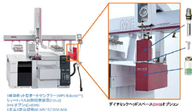
図-1 GERSTEL DHSシステム

GERSTEL DHSシステム (図-1) は、3軸ロボット型の多機能オートサンプラMPS robotic PRO のレール上に設置したDHSモジュール、試料トレイ、捕集管トレイと加熱脱着装置(TDU2)から構成されます。MPS robotic PRO のインジェクションユニットは、レール上を任意に移動し、試料バイアルや捕集管を、試料トレイ、DHSモジュール、加熱脱着装置に運ぶことでDHS、及びGCへの試料導入を行います。