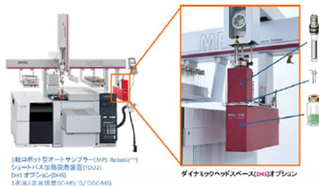
図-1 GERSTEL DHSシステム

GERSTEL DHSシステム (図-1) は、3軸ロボット型の多機能オートサンプラMPS robotic PRO のレール上に設置したDHSモジュール、試料トレイ、捕集管トレイと加熱脱着装置(TDU2)から構成されます。MPS robotic PRO のインジェクションユニットは、レール上を任意に移動し、試料バイアルや捕集管を、試料トレイ、DHSモジュール、加熱脱着装置に運ぶことでDHS、及びGC